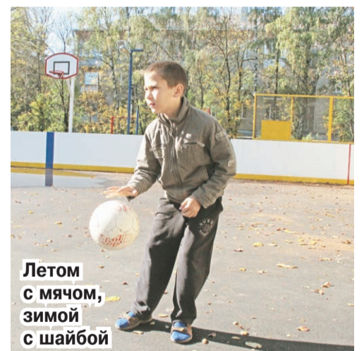
Летом с мячом, зимой с шайбой

П ОДРОСТКИ давно мечтали о спортивной площадке, многие из них тренируются в секциях. Теперь ребята смогут вдоволь заниматься любимыми видами спорта, ведь новая площадка универсальная. Летом на ней можно играть в футбол, волейбол, баскетбол, а зимой - кататься на коньках или играть в хоккей.