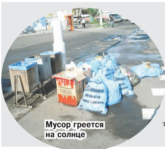
Мусор греется на солнце