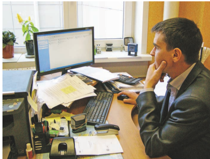
Все показания РиМов видны на компьютере

жения заметная разница в показаниях счётчиков. «Этому абоненту, - говорит он, - мы посоветовали оптимизировать схему подключения электроприборов для равномерного распределения нагрузки».