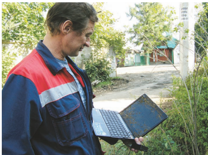
Дистанционный контроль с мобильного терминала

По его словам, счётчик, который устанавливается прямо на электрическом проводе, ведущем в дом потребителя, соответствующим образом сертифицирован. В ряде областей, включая некоторые районы Подмосковья, этих РиМов установ-