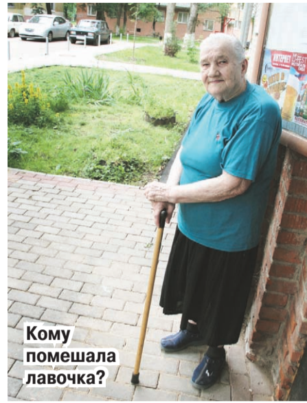
Кому помешала лавочка?

никто не спрашивал, нужны ли им лавки у подъезда, да и голосования никто не проводил. Она считает, что управляющей компании даже на руку то, что скамеек нет. Ведь их надо содержать в порядке - ремонтировать, подкрашивать. Вот они и пошли на поводу у нескольких жильцов.