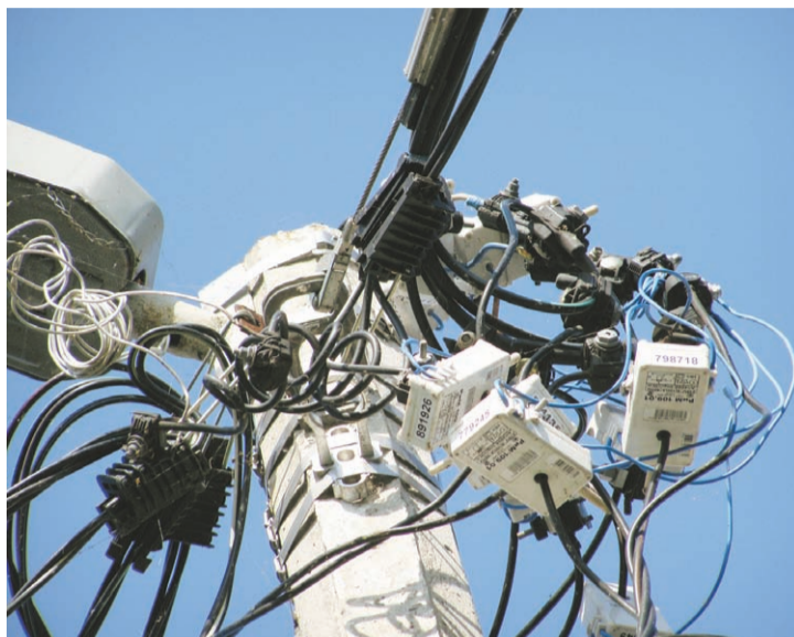
РиМами в районе украшены многие опоры

«Родники» неоднократно рассказывали о создании общедомовых узлов учёта электроэнергии в многоквартирных домах, эта программа в текущем году должна быть в основном завершена.