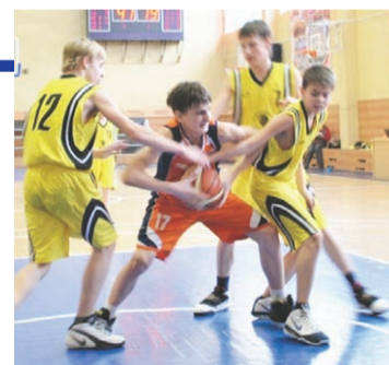
На площадке - команда юношей 1998 года рождения

Сегодня воспитанники Мытищинской детско-юношеской спортшколы олимпийского резерва по баскетболу проведут стартовые игры в новом сезоне.