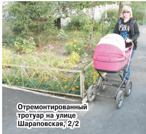
Отремонтированный тротуар на улице Шараповская, 2/2