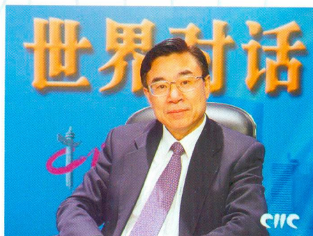
Хуан Юи Китай

Хуан Юи, член Экономического и социального совета Китая, член Всекитайского комитета Народного политического консультативного совета Китая (ВК НПКСК) двенадцатого созыва, бывший вице-президент Международной издательской группы Китая, генеральный секретарь Китайской ассоциации переводчиков.